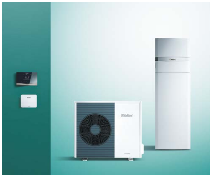
Pompa ciepła powietrze/woda aroTHERM Split z centralą grzewczą uniTOWER