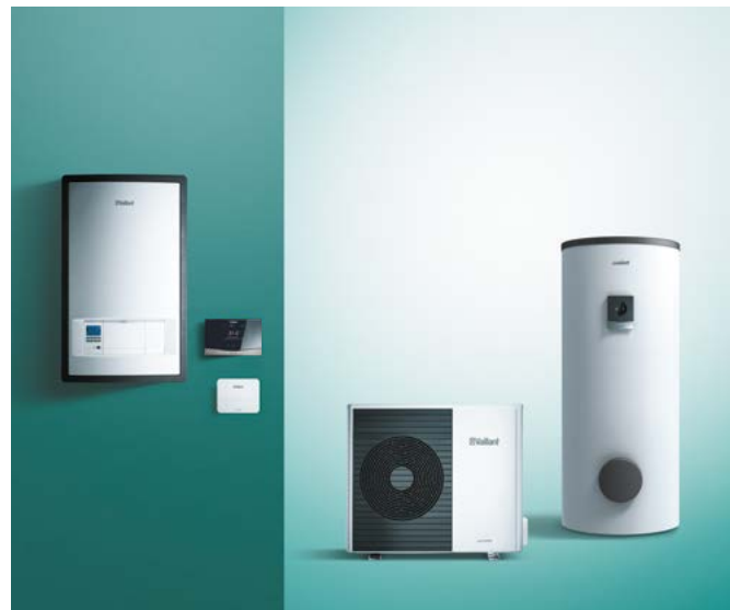
Pompa ciepła powietrze/woda aroTHERM Split z tradycyjnym zasobnikiem i modułem hydraulicznym

Pompa aroTHERM umożliwia zastosowanie różnych rozwiązań dostosowanych do wymagań klientów zarówno w nowych, jak i modernizowanych budynkach. Pompa ciepła powietrze/woda może być połączona, zależnie od sytuacji, z kompaktową jednostką wewnętrzną lub z odpowiednimi podzespołami.